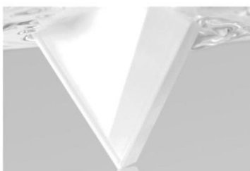
El lacado láser protege el material contra la penetración de humedad.