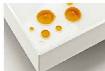
Efecto Lotus. Gotas de líquido se deslizan sobre la superficie.