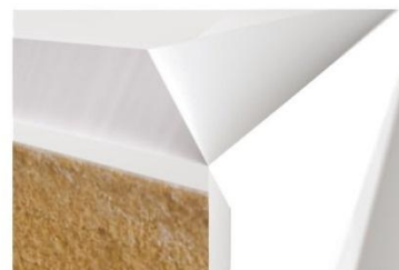
Efecto real de vidrio a través de los 45°.