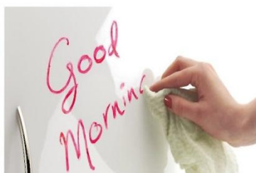
Es posible el uso de marcadores.