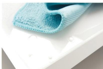
Fácil limpieza con agua y paño de microfibra.